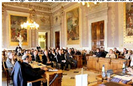
La sala Consiliare del Palazzo Regio